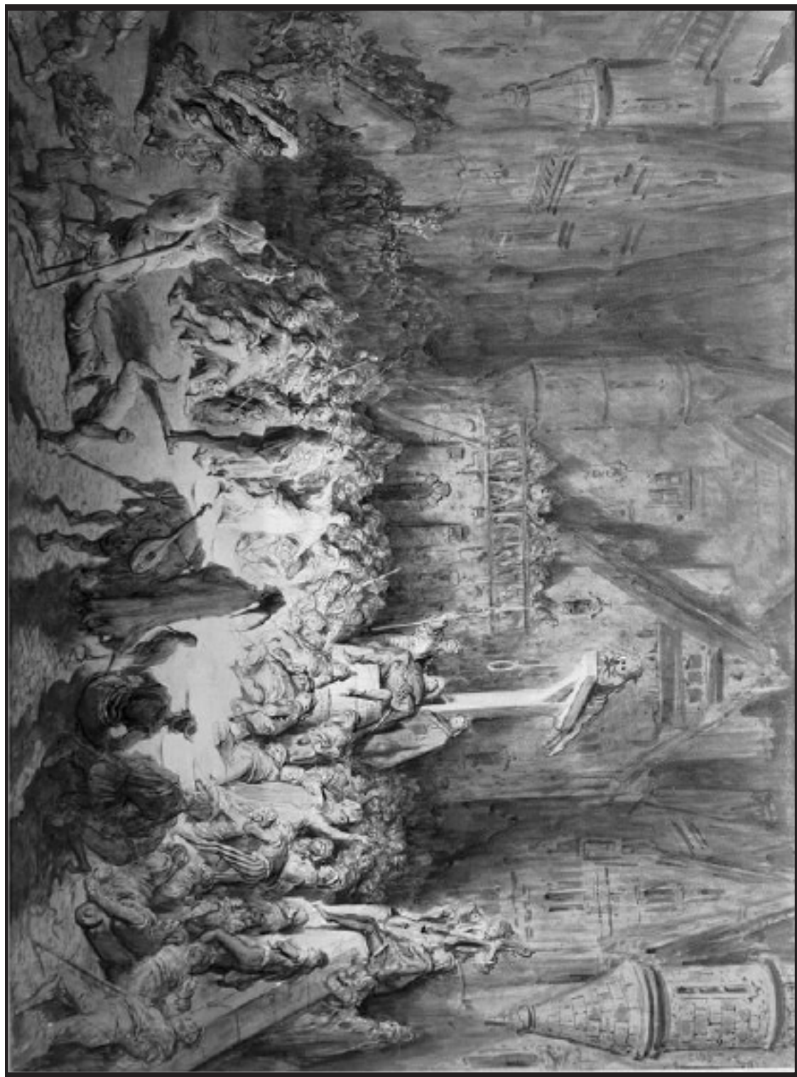
La cour des miracles, Gustave Doré