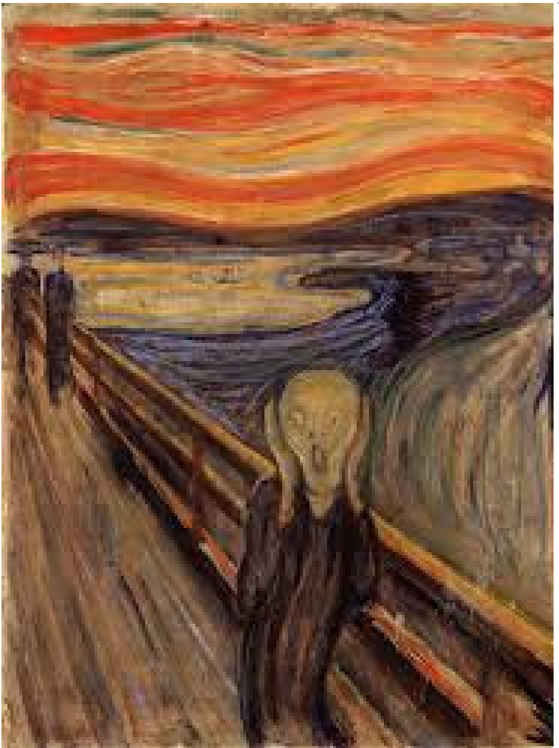
Le Cri, Edward Munch